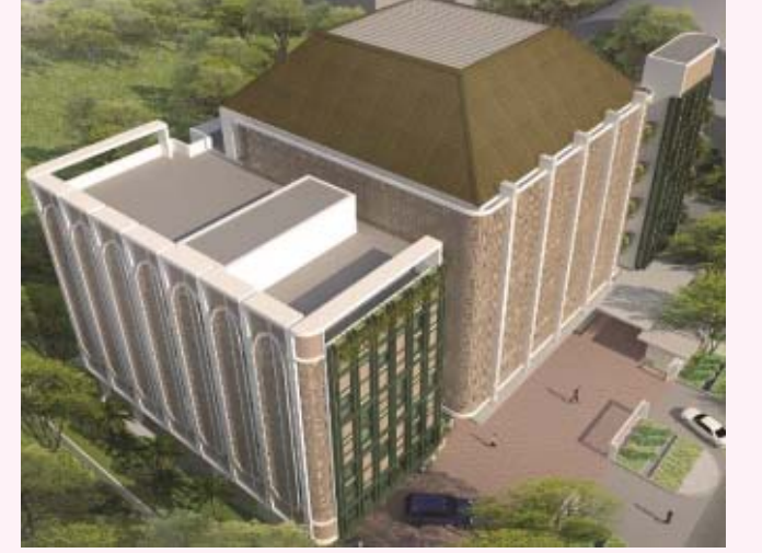
இஸ்லாமியா கல்வி நிலைய வளாகம், சுமார் 17 மில்லியன் வெள்ளி செலவில் கட்டப்படவுள்ளது. 2020 ஜனவரியில் இயங்கத் தொடங்கும்.

பசுமையான இயற்கைத் தோற்றத்துடன் அமைக்கப்படும் அல்-அராபியா ‘நுஸாந்தரா’ நவீன கோட்பாட்டு மையமாகவும் திகழும், அல்-இஸ்லாமியா கல்வி நிலைய மாணவர்களுக்கு உயர்நிலைப் பள்ளித்தரமுடைய அறிவியல் பாடமும், வலுவான இஸ்லாமிய நெறிமுறை களும் கற்பிக்கப்படும். நவீன வசதிகளைக் கொண்ட மதரசா அல்-அராபியா அல்-