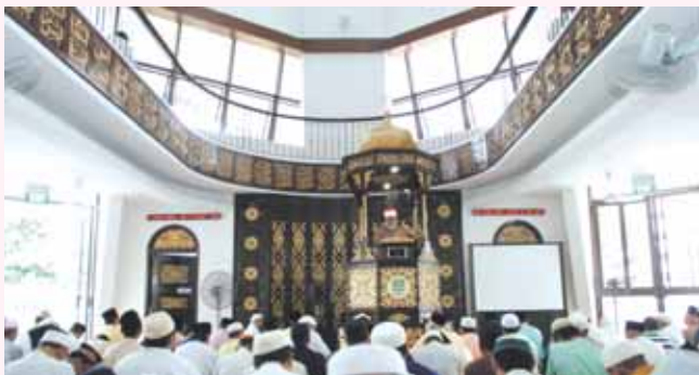
Opening of new annex building at Al Mukminin mosque on 1st Sept 06