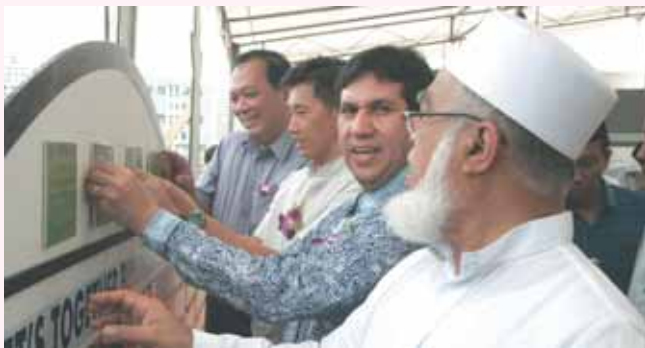
Announcement of site for Sengkang Mosque on 12th Aug 06, first in phase 4 of MBF programme