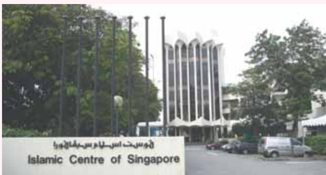
Last day at MUIS building and last Friday prayers at Muhajirin mosque - 8th Sept 06