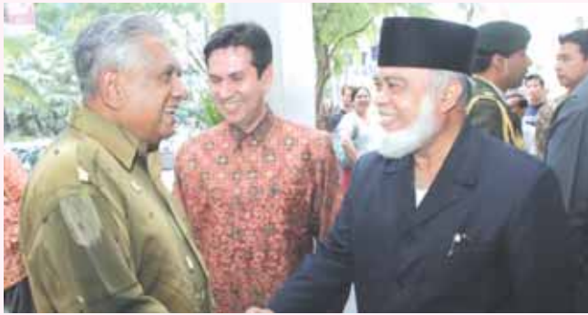
MUIS President Challenge High Tea 2006 at Grand Hyatt Singapore on 9th Sept 06