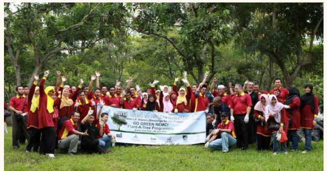
Rahmatan Lil Alamin Go Green Plant-A-Tree programme at Bedok Town Park, 26 Jun 2010