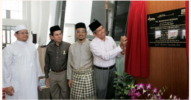
Official opening of Al-Mawaddah Mosque, 21 May 2010