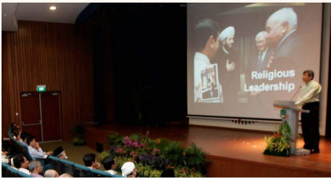
MUIS work plan seminar 2010 at SIH, 10 Apr 2010