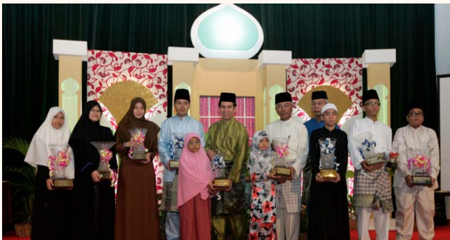
Tilawah & Tahfiz Al-Quran ceremony (national level) for 2010/1431H at Sultan Mosque, 30 May 2010