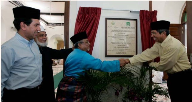
Official re-opening of Omar Kampung Melaka Mosque, 4 Jun 2010