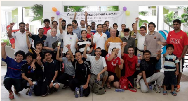
Community Engagement Games Day 2010 at SIH, 26 Jun 2010