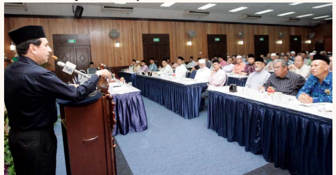
42nd Mosque Council meeting at Ar-Raudhah Mosque, 24 Apr 2010