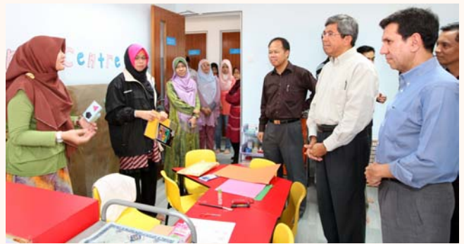
Minister Dr. Yaacob Ibrahim chatting with Asatizahs at Al-Ansar mosque's temporary site, 4 Sep 2012