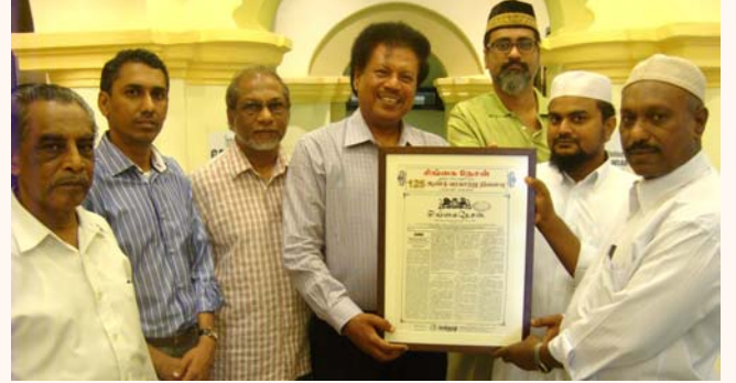
மகிழ்ச்சியடையவும் யாம் பிரயோசனமடையவும் இக்கடவுள் கிருபை செய்வாராக.”

“இப்பத்திரிகை நெடுங்காலம் நீடிக்கவும் இதனை வாசிப்போர் அறிவிலே தேறி