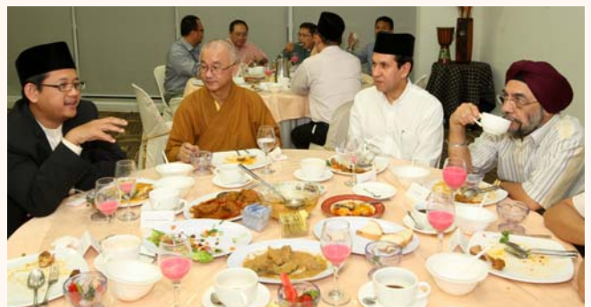
Interfaith Iftar, Harmony Centre, 3 Aug 2012