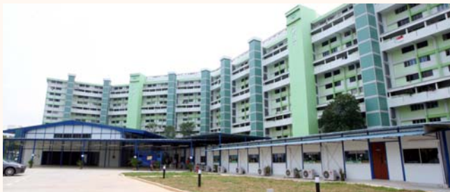
Minister for Information, Communication and the Arts and Minister in charge of Muslim Affairs, Dr. Yaacob Ibrahim's visit to Al-Ansar mosque's temporary site, 4 Sep 2012