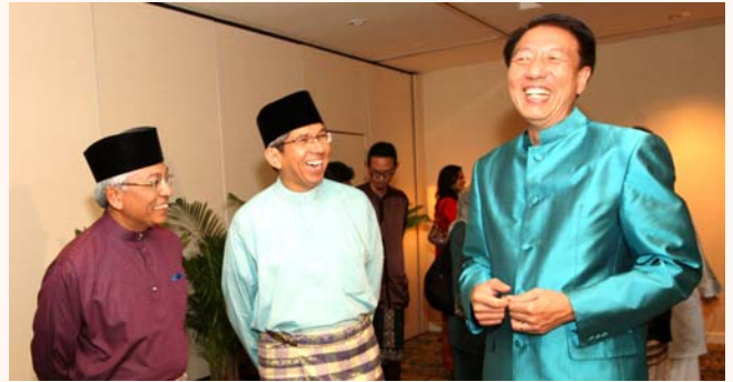
DPM Teo Chee Hean at Hari Raya get together, Fairmont Singapore, 31 Aug 2012