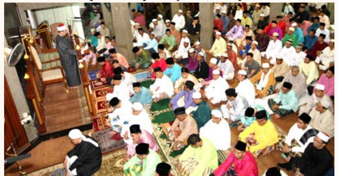
Congregation at Darul Aman mosque for Eidul Fitr prayers, 19 Aug 2012