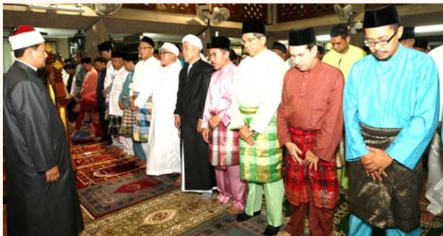
Mufti Dr. Mohamed Fatris Bakaram, leading Eidul Fitr prayers at Darul Aman mosque, 19 Aug 2012