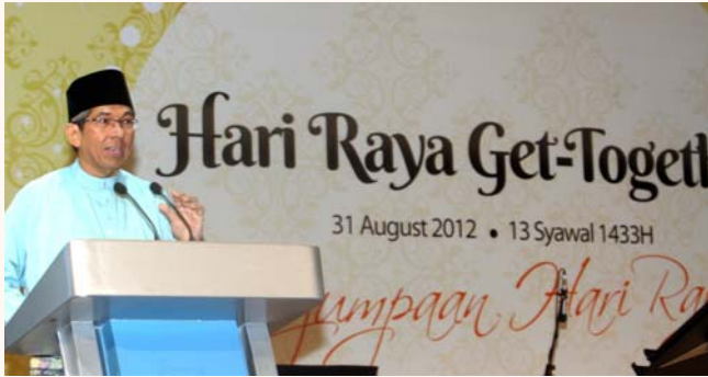
Ministers' Hari Raya get together, Fairmont Singapore, 31 Aug 2012