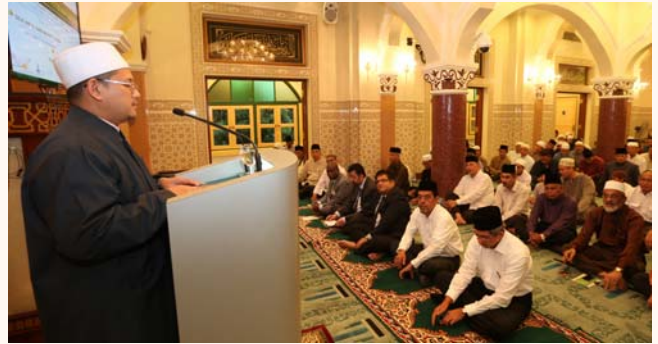
Zikral Hijrah celebration 1435H at Khadijah Mosque, 4 Nov 2013