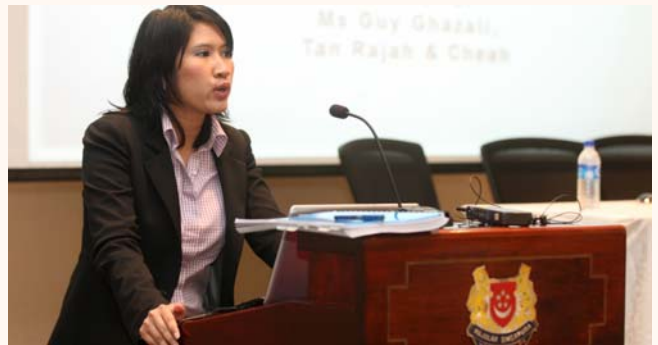
Legal forum for Asatizah at The Subordinate Courts of Singapore, 31 Aug 2013