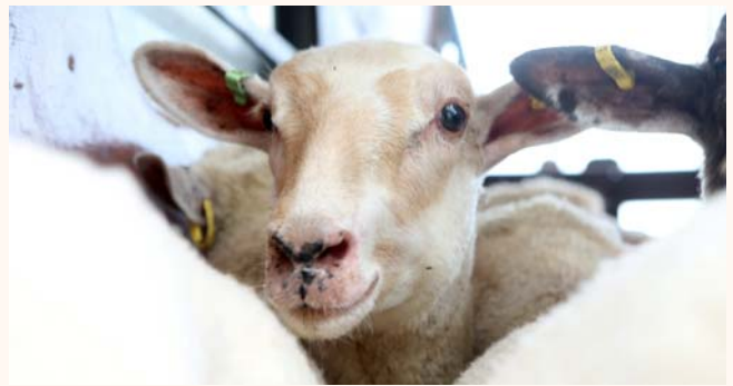
Eidul Adha Qurban Rites - Canadian lambs imported in addition to Australian lambs