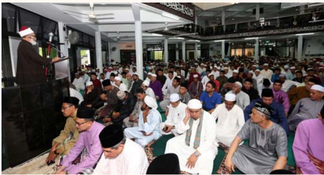
Hari Raya Eidul Adha prayers at Darul Makmur Mosque, 15 Oct 2013