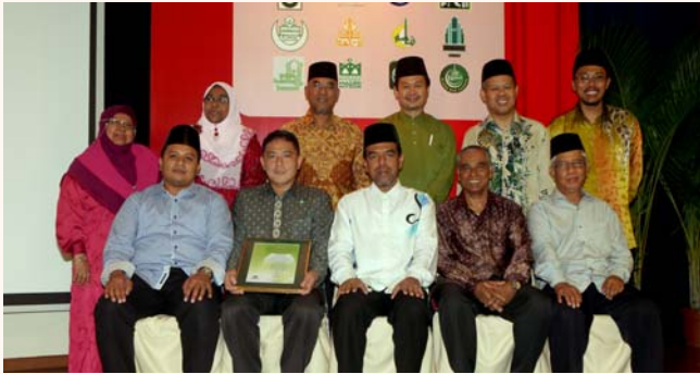
Mosque Management Board (MMB) Investiture, 16 Nov 2013