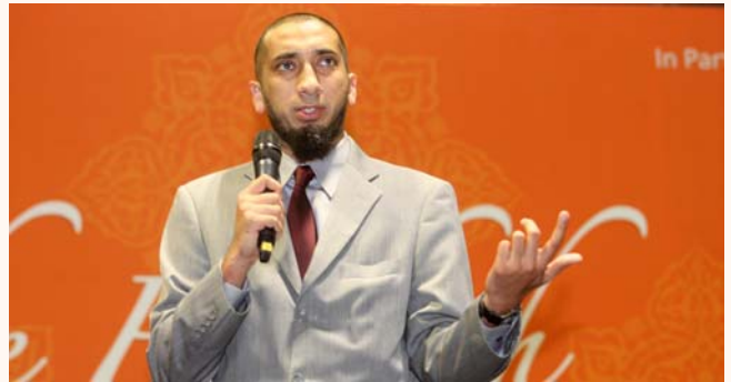
Mr. Nouman Ali Khan at 6th instalment of Youth aLive discourse at Suntec City, 7 Sep 2013