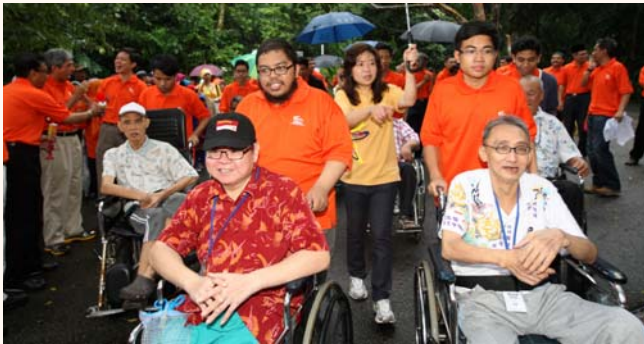
6th Rahmatan Lil'Alamin (blessings for all) at Singapore Botanical Gardens, 29 Sep 2013