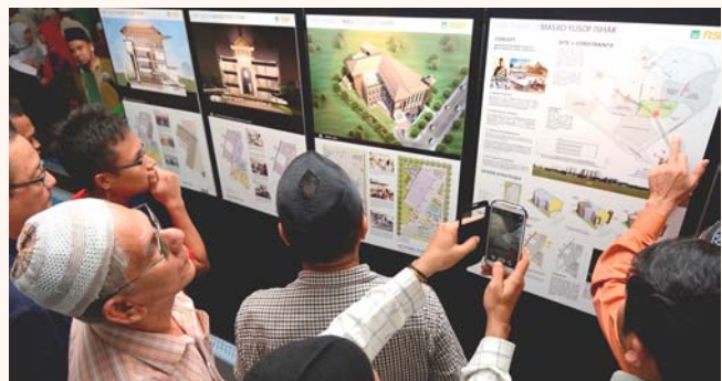
Launch of Yusof Ishak Mosque roadshow, 22 Aug 2014