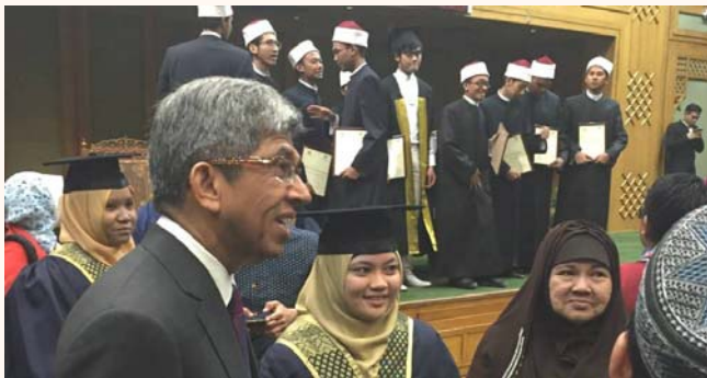
Graduation ceremony and dialogue session with S'pore students at Al Azhar Conf. Centre, Egypt, 3 Nov 2014