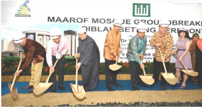
Maarof Mosque groundbreaking and kiblat direction setting ceremony, 6 Dec 2014