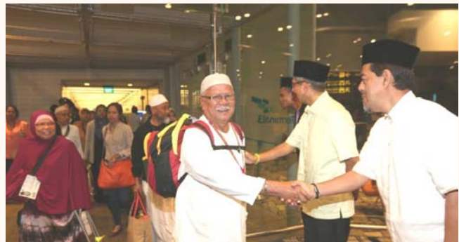
Singapore pilgrims returning from Hajj, Changi Airport, 27 Oct 2014