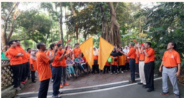
Rahmatan Lil Alamin (RLA) blessings to all day, 28 Sep 2014