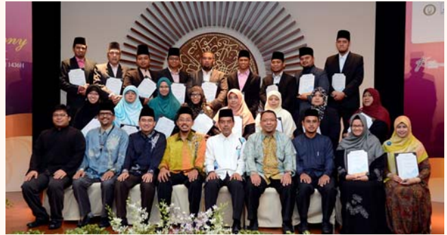
Mosque Management Board investiture, Singapore Islamic Hub, 15 Nov 2014