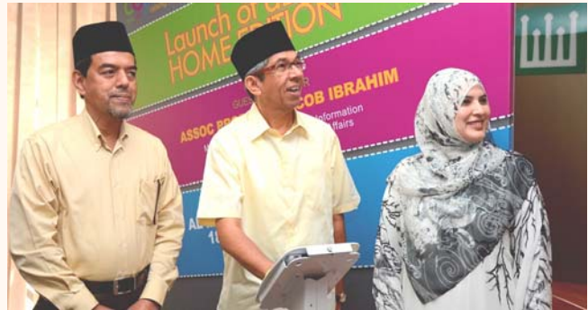
Launch of aLIVE Home Tuition, 18 Oct 2014