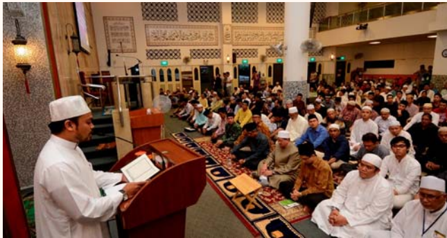
Zikral Hijrah 1436 celebrations, 24 Oct 2014