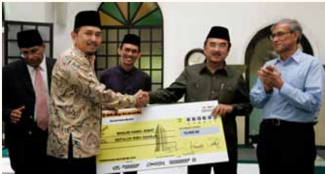
Cheque presentation by Chief Minister of Malacca to Masjid Omar Kg Melaka and Masjid Hang Jebat