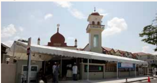
Public official re-opening of Abdul Razak Mosque