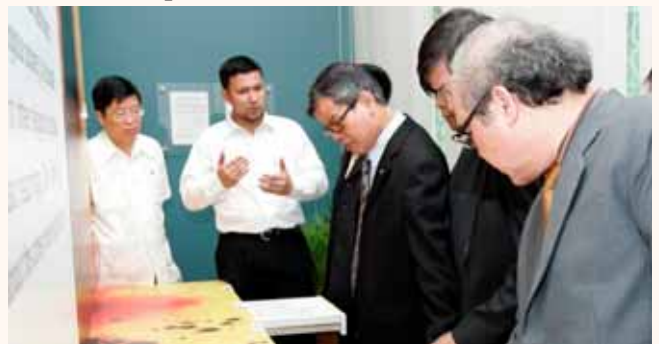
Visit by Vietnam Government Committee for Religious Affairs to Harmony Center on 29 May 2009