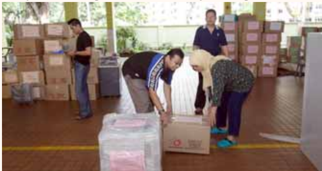
MUIS move to Singapore Islamic Hub (SIH) on 10 Apr 2009