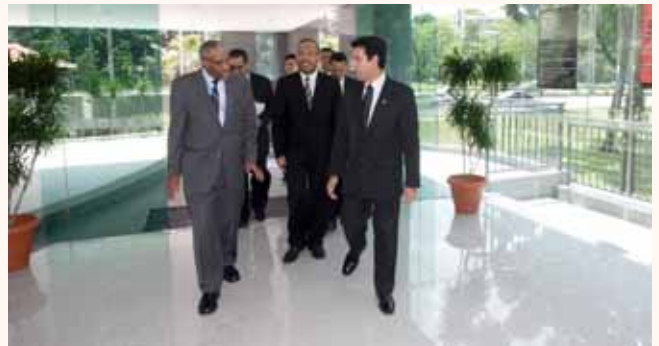
Visit by IDB President to Singapore Islamic Hub (SIH) on 7 May 2009