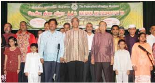
16 Indian Muslim Organisations under FIM celebrated National Day on 2 Aug 2009