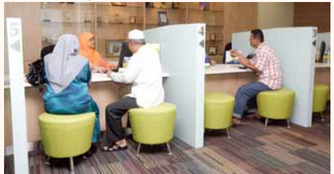
MUIS 1st day of operation at Singapore Islamic Hub (SIH) on 11 Apr 2009