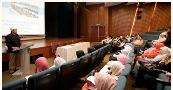
Session with parents as part of pre-departure for overseas bound students, 2 Jul 2011