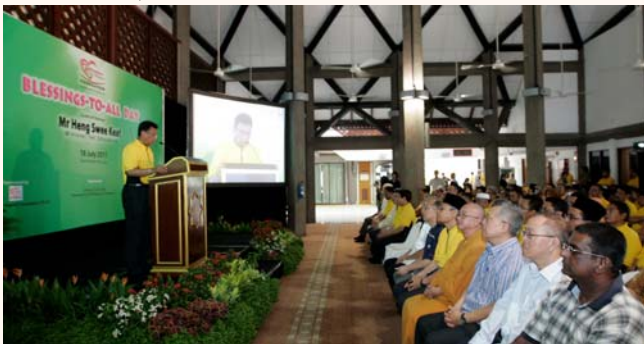
4 th Rahmatan-Lil-Alamin (Blessings-to-All) Day, 16 Jul 2011