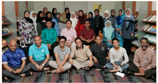
Singapore Haj Mission Orientation & Training workshop 2011/1432H, 23 & 24 Jul 2011