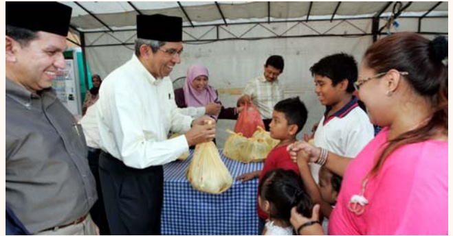
Minister's Distribution of Ramadan Porridge to needy residents at Al-Amin Mosque, 2 Aug 2011