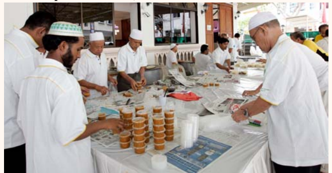
President's Challenge Charity Briyani 2011, 16 Jul 2011