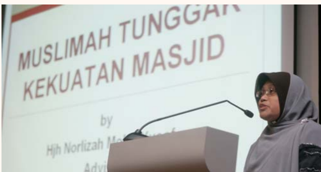
Muslimah Seminar - Townhall meeting, 5 Jul 2011