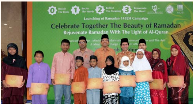
Launch of Touch of Ramadan celebrations 2011/1432H, 30 Jul 2011