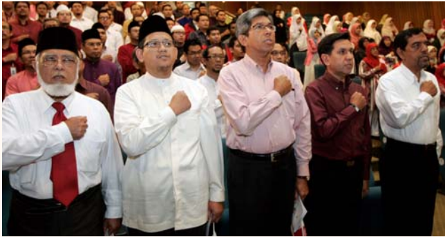
National Day Observance Ceremony 2011, 5 Aug 2011